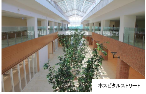
ホスピタルストリート