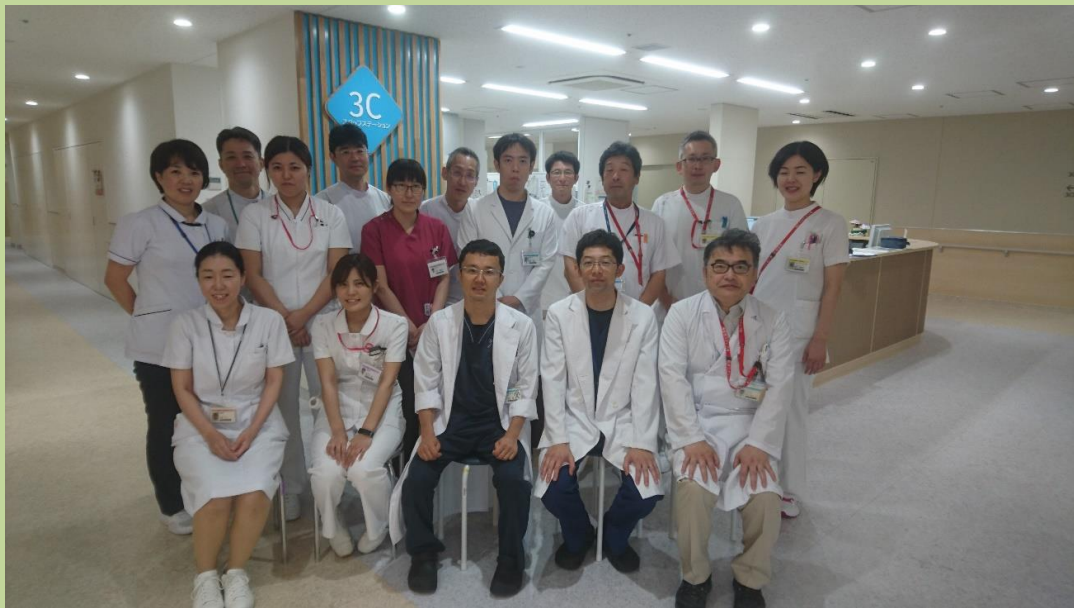
病棟回診のスタッフ（呼吸器外科、リハビリテーション科、病棟・手術室看護師）

また、分子標的薬使用例では進行・再発肺癌の中間生存期間が従来の治療の約1年から3年程度まで延長しました。また、免疫チェックポイント阻害剤使用例では少数ではありますが治癒も期待されています。薬物療法の進歩に伴い、自宅で過ごす期間が長くなった一方で、長期にわたる症状緩和や薬の副作用管理が必要となりました。特に分子標的薬や免疫チェックポイント阻害剤では皮疹、下痢・大腸炎、間質性肺炎、甲状腺機能異常、糖尿病など全身に多彩な副作用が出現する可能性があります。また当センターでは、遠方から通院している患者様も多く日常生活をサポートするため、さらに地域の医療機関との連携を図る必要があると考えています。