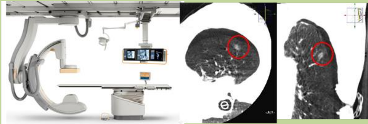
ハイブリット手術室の X 線装置(Cone beam CT)を用いて術中に再構成した画像

胸腔鏡を用いた肺切除は従来、気胸や肺生検などの肺部分切除にのみ行われていました。現在では従来、開胸手術で行われていた肺癌に対する標準術式である肺葉切除、リンパ節郭清も胸腔鏡を用いて行うことが可能となりました。当センターでは年間約 150 例の肺癌手術を行っていますが、2017 年には胸腔鏡手術が 100 例/年を超え、約 2/3 の症例で胸腔鏡を用いた低侵襲治療を行っています。また、術中腫瘍部位が同定困難であるような小結節病変にたいしては、ハイブリット手術室で手術を行っています。以前は術前に CT 下にマーカー針を肺に留置することで腫瘍の位置を同定していましたが、気胸、空気塞栓など合併症の懸念がありました。ハイブリット手術室では手術台のうえで X 線で透視したのち CT と同様の画像を術中に再構築することにより、触診することなく小さな傷で安全で確実な肺切除が可能となりました。