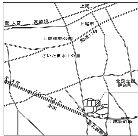
今回対象施設 埼玉県立精神医療センター