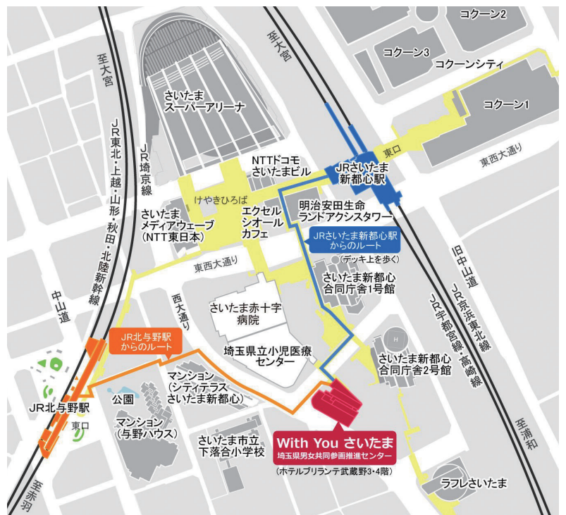
埼玉県立小児医療センター