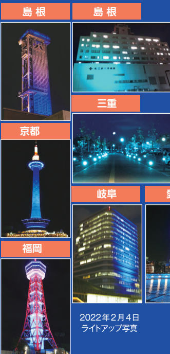
2022年2月4日 ライトアップ写真

日本各地でライトアップの点灯式をおこない、日本国内のみならず世界にむけて、がんに立ち向かう想いを発信します。