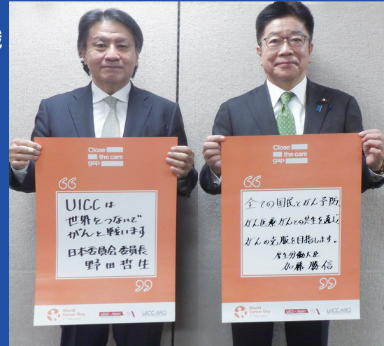
Close the care Gap メッセージ

ワールドキョンサーデーは世界中の人々が、がんのためにできることを考えて行動を起こす日です。UICC日本委員会ではオンラインで、ライトアップ点灯式とワールドキョンサーデー・セッションを加盟組織で共同開催いたします。 2月4日の夜空をブルーとオレンジの光に包むライトアップが、世界各地で行われます。コロナ禍で、人と人の距離を離さなければならないいま、距離を超えて、日本各地の光を繋ぎ、未来にむけてがんという病への想いをひとつにする瞬間をともに分かち合ひましょう。