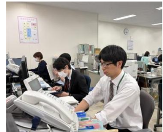
小児医療センター 職場風景