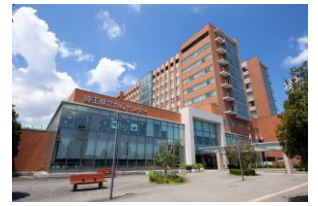
がんセンター外観写真