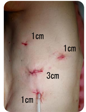
左肺癌手術のキズ