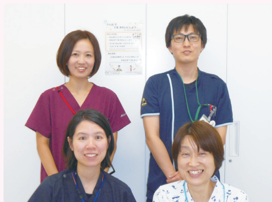
私たちが分かりやすく説明します

くすりを上手に飲ませることができますか？くすりを飲まない人はいない！くすりとうちに付き合うためのエッセンスをお届けできたらと思います。