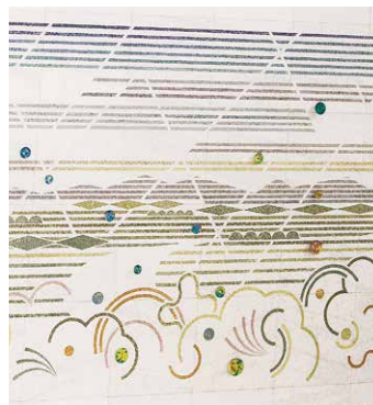
エントランスホール壁面(光の舞)