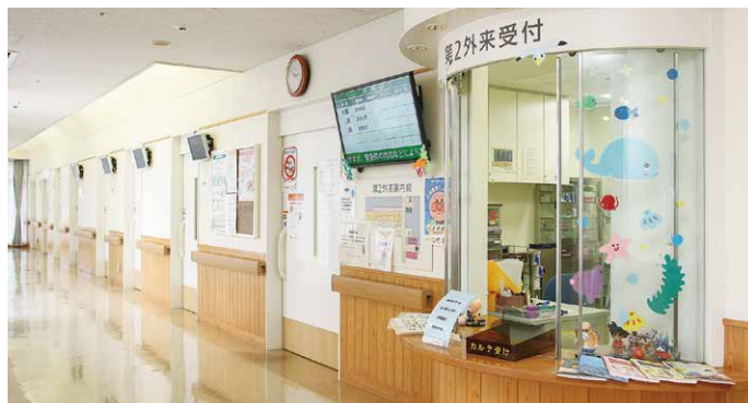
第二外来(小・中学生を対象とした外来)受付