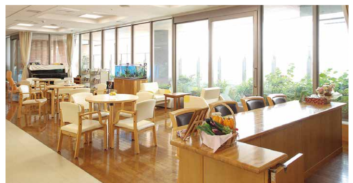
緩和ケア病棟デイルーム