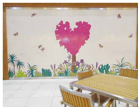
シンボルマークのハートツリー