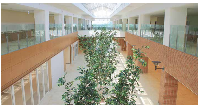
ホスピタルストリート