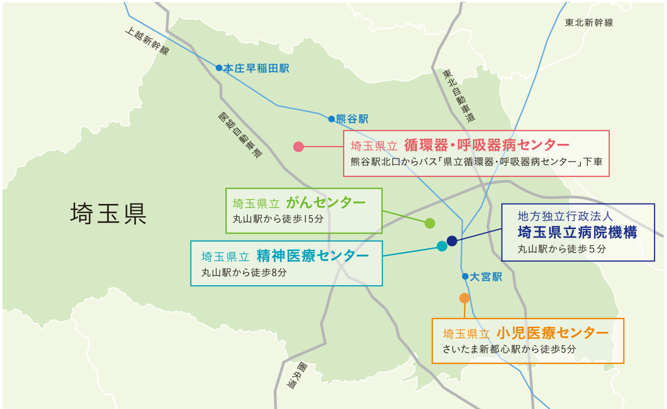
埼玉県立循環器・呼吸器病センター